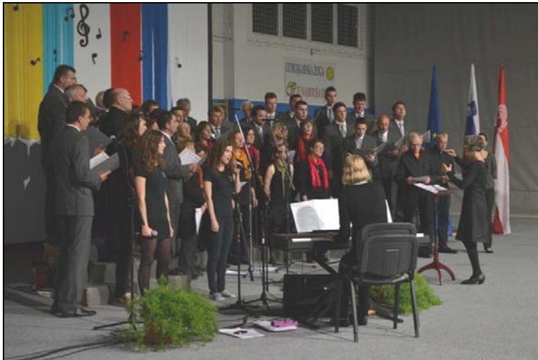
Konsert i Slovenien i oktober 2012