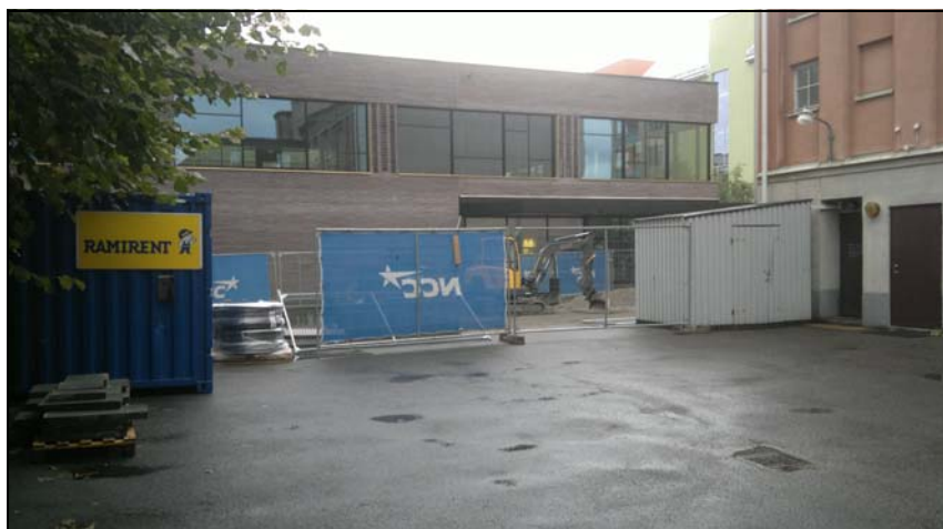
Gården kan bara bli bättre än så här.