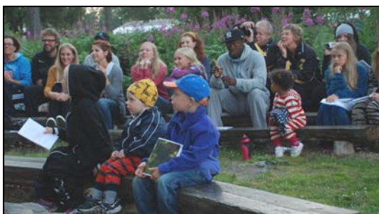
Intryck från Skeppsgården.

vi avslutat bön- och lovsångsstunden i ring och hade fått välsignelsen så kramades alla. Vi tyckte det var lite konstigt. Vi fortsatte gå med varje kväll och efter ett par dar förstod vi det fina, hur alla tog hand om varandra, tröstade om någon var ledsen. Alla därinne kom fram och tröstade om någon var ledsen, även de man kanske aldrig pratat med. Vi stannade kvar på alla bön- och lovsånger hela lägret fast den var frivillig.