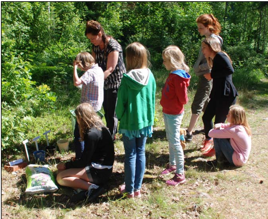
Lägerbarnen jobbar med liknelsen om sådden.

Det finns tyvärr inga startdatum för höstens verksamheter. Information kommer senare när de olika verksamheterna startar.