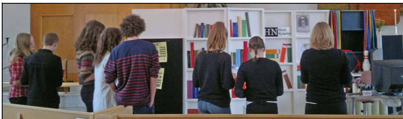
Ungdomar på tillsammans gudstjänst.

Titta ofta efter uppdateringar och information! Du får även ladda upp bilder själv på Facebook.