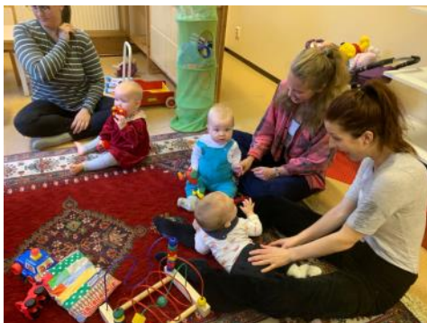
Musik och lek på babysång (ovanför).

Det var mycket för barnen att leka med på Falketorpsslägret (till höger).