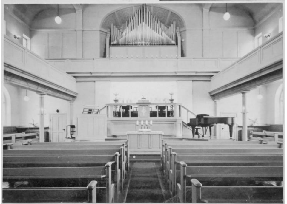
Adelfiakyrkan innan ombyggnaden.

Kyrkan återinvigdes domsöndagshelgen 1981. På lördagskvällen hölls en nattvardsgudstjänst. På söndagen var det