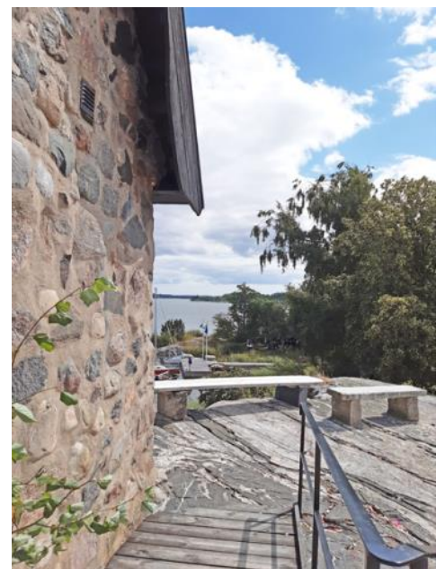
En minnesvärd dag på Capella.

Kyrkkaffet med hembakt dopp serverades vid "Margareta- stugan" nära bryggorna.