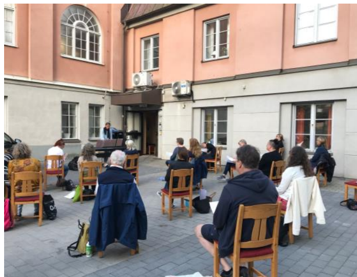
Soon Gospel övar på kyrkans parkering.

Diakonicentrum spelade in en sinnesroandakt i kyrkan, den sändes den 13 maj kl 18. Andakten kan ses på deras Facebooksida (sök på Diakonicentrum).