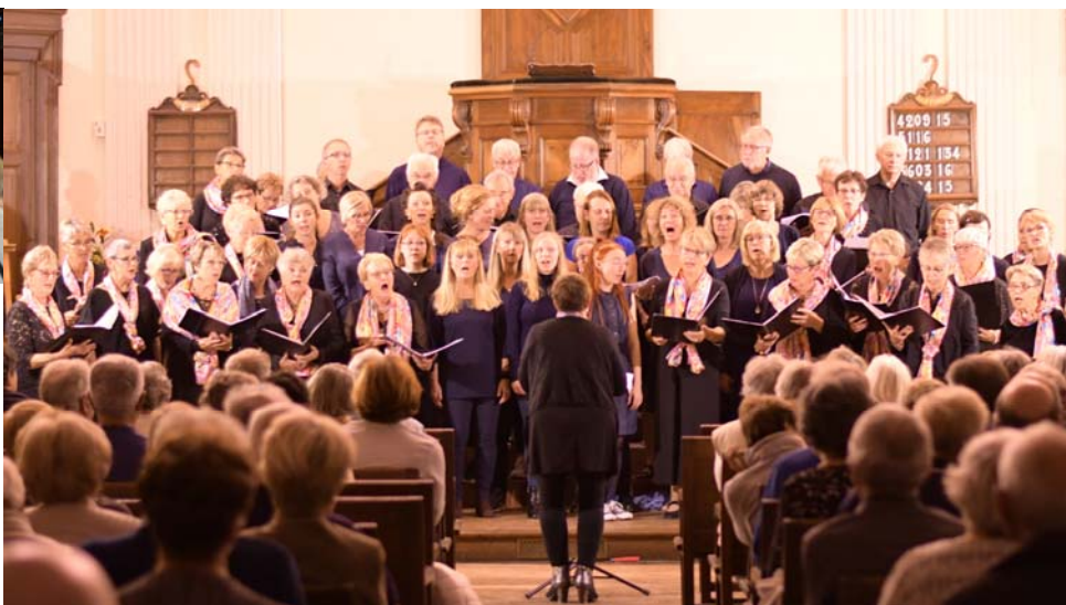
Två körer sjunger tillsammans i det protestantiska templet i Bergerac.

På något sätt hade det spridits att vi var Sveriges bästa gospelkör och dessutom gör vi mycket mer än att bara sjunga. I båda fallen var kyrkan full – trots att det fanns många bönder i området och vi kom mitt i skördeti-