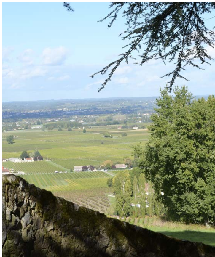
En av många vackra utsikter.