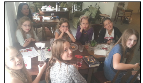
Fika efter Löfteslandet.