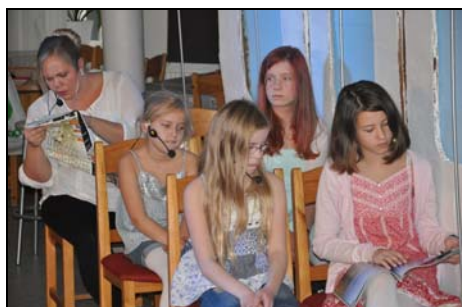
På flyplanet på väg till Turkiet.

Den 26 oktober förvandlades caféet till en teater och vi fick vara med om en musikalgudstjänst, "Det stora skalvet". Musikalen hade skrivits av ungdomsledaren Frida och framfördes av Studio 113.