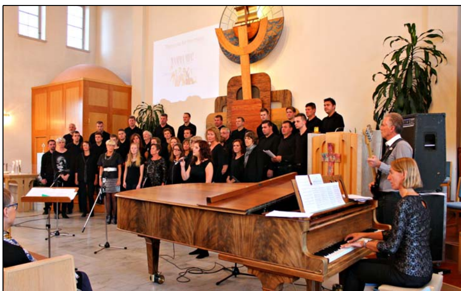
Körerna sjunger "Thank you for the music" tillsammans.