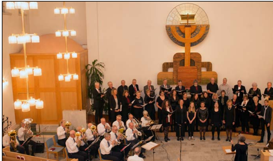
Total Praise framförs av Förenade Brass, Centrumkyrkans kör och Soon Gospel.

Sjukhuskyrkan har en viktig uppgift att bedriva andlig vård inom Vrinnevisjukhusets upptagningsområde. Verksamheten delas mellan Svenska kyrkan och frikyrkorna i ett nära samarbete. Svenska kyrkan har en stark representation med präst, diakon och deltidsanställd kantor. Den frikyrkliga delen leds av Frikyrkliga Sjukhusutskottet – förkortat ”Friskus” – ett uttryck vi ofta använder i styrelsesammanhang. Styrelsen består av representanter från de deltagande samfundet och är arbetsgivare för