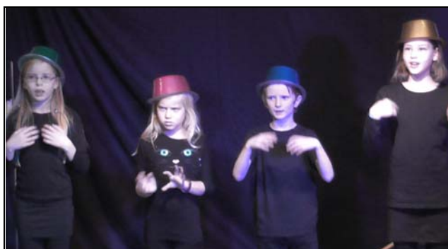
Studio 113 uppträder på Local Heroes.