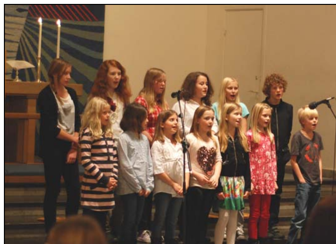
Kom på fest! Glädjebarn sjunger på gemensam gudstjänst i Immanuelskyrkan.