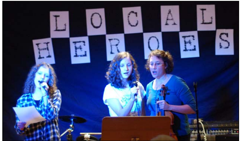
Mycket sång och musik på Local Heroes.