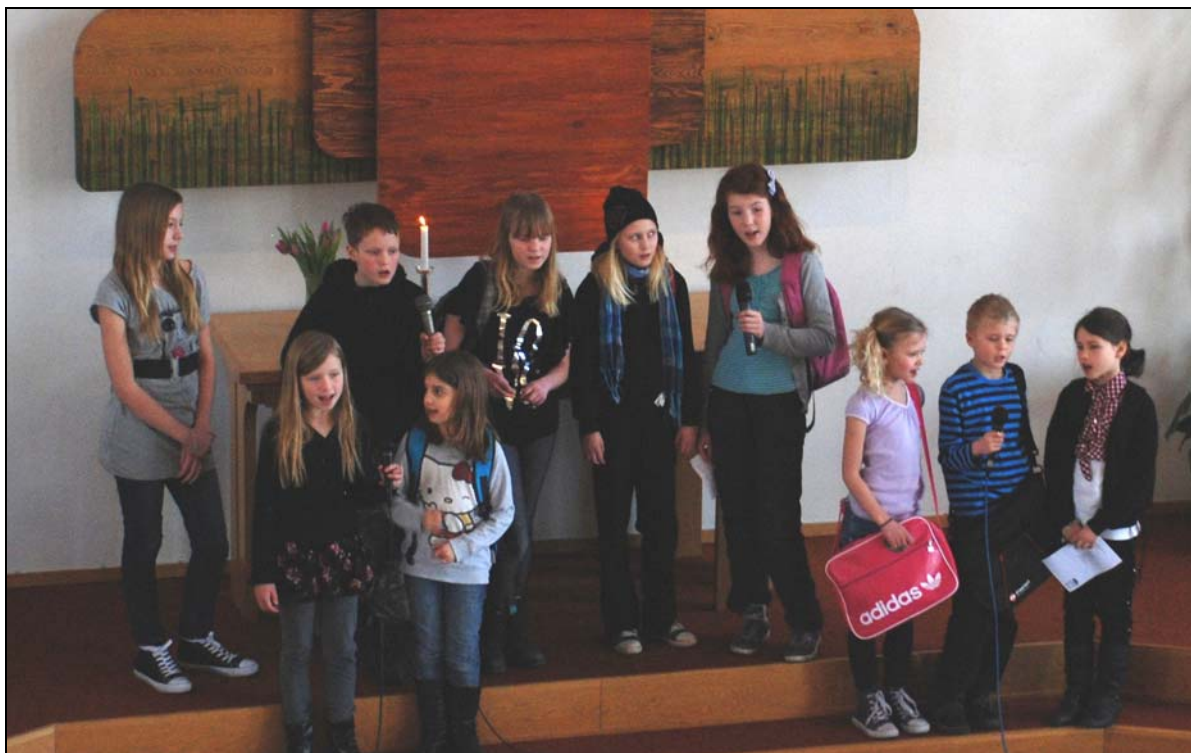
Avslutning på musikal gudstjänsten med Glädjebarn.