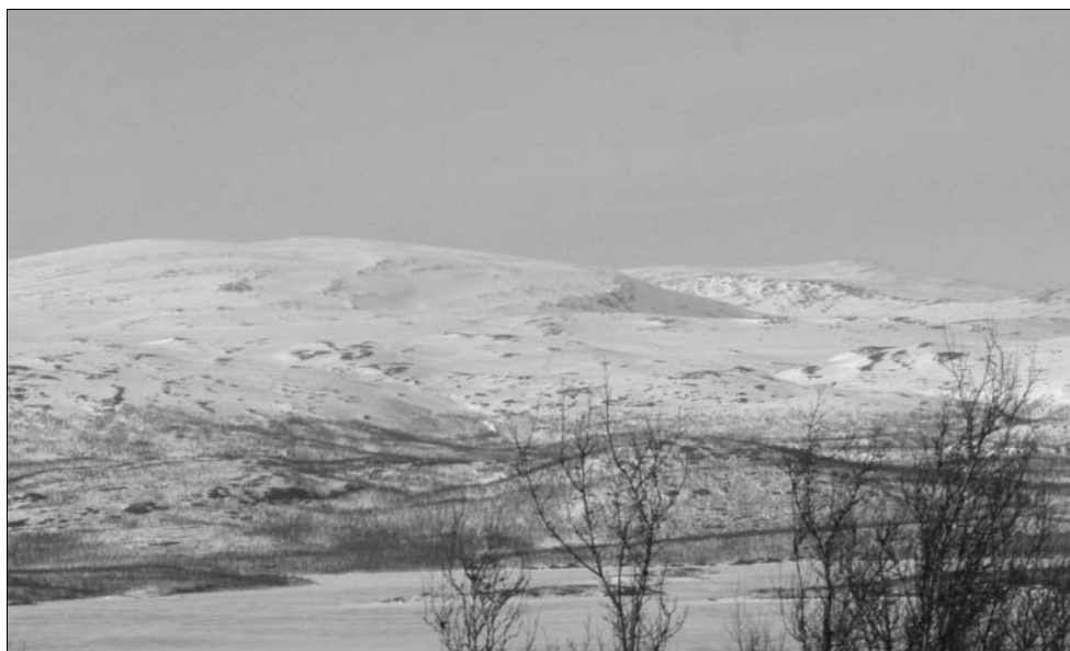
Svenska kalvfjäll – snart ett minne blott?

(utdrag ur brevet gjort av Gunilla Arlinger)