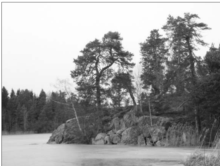
Den vackra svenska naturen.

Jorden är Herrens med allt den rymmer, världen och alla som bor i den.