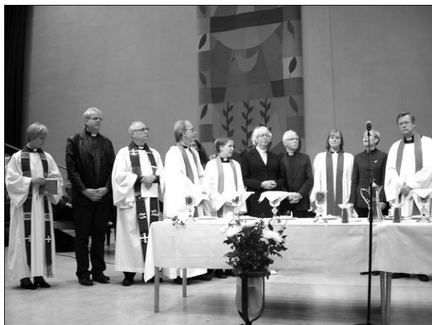
Ekumeniska nattvardsgudstjänst i Pingstkyrkan, oktober 2006.

I stället för att känna en rädsla för att vår tradition och våra bärande idéer ska tunnas ut kanske vi i stället ska se dem som ett viktigt bidrag vi får tillföra helheten.