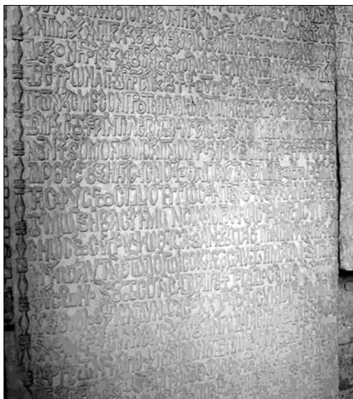
Den tre meter höga stentavlan med karaktärer i 5-centimetersklassen som finns i nuvarande Hagia Sofia i Istanbul. Inhugget är protokollet från 2:a ekumeniska kyrkomötet i Konstantinopel år 381.

Missionen erbjuder numera utbildning av unga kristna som är kallade till pastorer och lärare. På flera platser i missionsländerna finns församlingar med egna infödda pastorer. Ett tecken på att verksamheten burit frukt. (forts.)