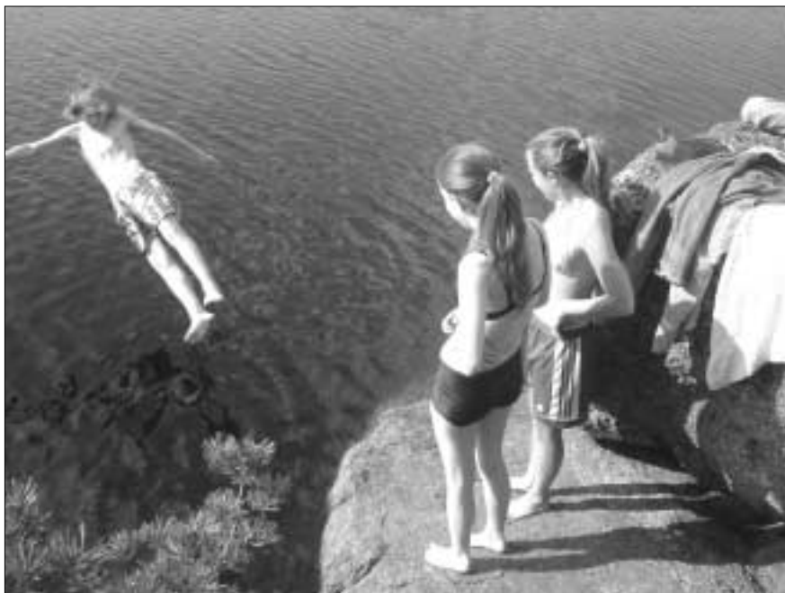
Några ungdomar vågar sig på vårens första dopp.

Limmnäs blir årets plats igen för familje-/församlingslägret. Förra året gav mersmak, trots enkel standard. Detta riktar sig i första hand till barnfamiljerna,